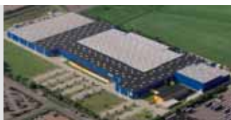
Hörmann KG Brandis