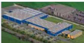
Hörmann KG Antriebstechnik