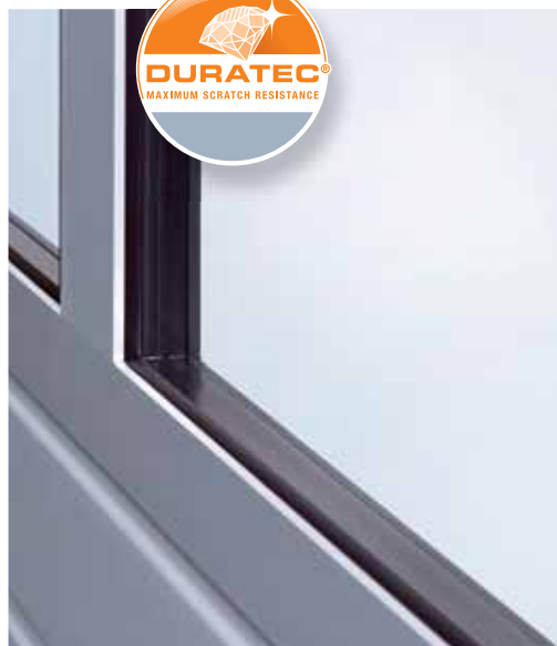
Nové prosklení o tloušťce 26 mm