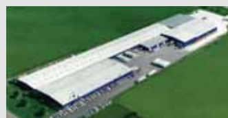
Hörmann LLC, Montgomery IL, USA

Společnost Hörmann nabízí ve svém sortimentu jako jediný výrobce na evropském trhu všechny důležité stavební prvky.