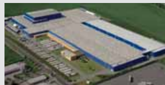
Hörmann KG Ichtershhausen