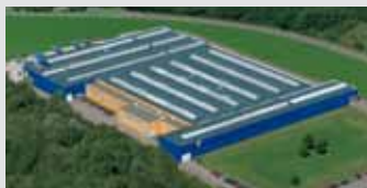
Hörmann KG Eckelhausen