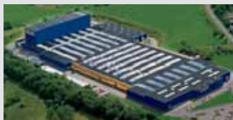
Hörmann KG Freisen