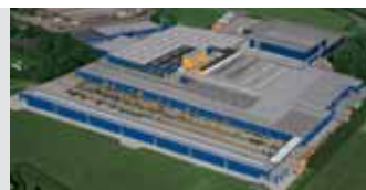
Hörmann KG Brockhagen