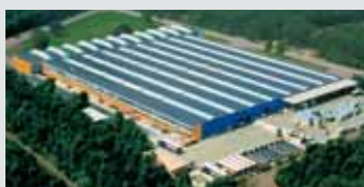
Hörmann Genk NV, Belgien